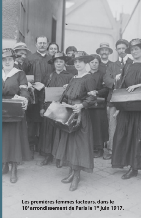
Les premières femmes facteurs, dans le 10 e arrondissement de Paris le 1 er juin 1917.