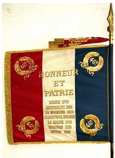
Drapeau du 46 e régiment d'infanterie

La 5 e rencontre de généalogie organisée par LARENA77 se tiendra à Moret-sur-Loing , les samedi 2 et dimanche 3 avril 2016 de 9 h à 18 h , à la salle des fêtes, route de St Mammès.