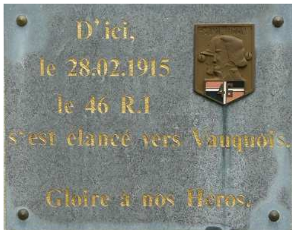
Plaque du monument du 46° R.I. à Vauquois

Vous y retrouverez entre autres les premiers essais de lance-flammes , aux résultats aléatoires, réalisés, sur le front, par la Brigade de Sapeurs-Pompiers de Paris, mais aussi, la guerre des mines où chacun des protagonistes tentait de creuser toujours un peu plus profondément, jusqu'à 50 mètres sous terre pour placer une charge explosive de plusieurs dizaines de tonnes sous les lignes ennemies. Ainsi, la plus grosse mine explosa le 14 mai 1916 sous la première ligne française provoquant un entonnoir de 80 mètres de large sur 20 mètres de profondeur, engloutissant 108 soldats du 46 R.I.