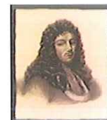
Jean Talon, Intendant de la Nouvelle-France, 1665-1675. Musée de la Nouvelle-France

L'intendant Jean Talon est généralement considéré comme étant celui qui a mené le premier recensement moderne. Envoyé par Louis XIV pour administrer la colonie de la Nouvelle-France, Talon a reconnu l'importance d'avoir des renseignements fiables sur lesquels il pouvait se fonder pour organiser la colonie et favoriser son développement.